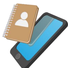
кон т ак т ы