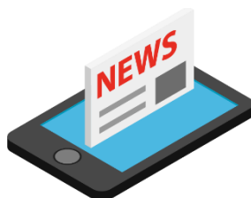
но в ости