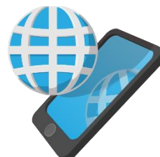
И н тер н ет