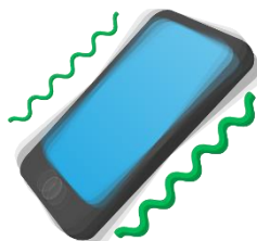
ви б ро звук