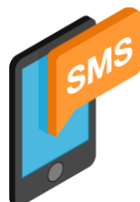
с м с сообще н ие