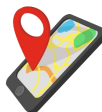
навиг а тор