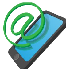
электр о нная п о ч т а