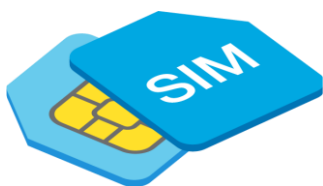
с и м-кар т а