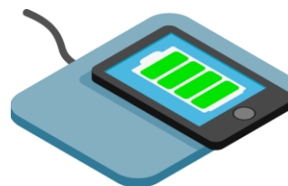
зар я дка