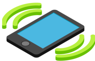
звон о к