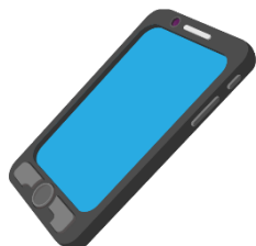
моби л ьник