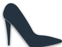
ту́фли на каблу́ке