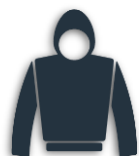
кóфта с капюшо́ном